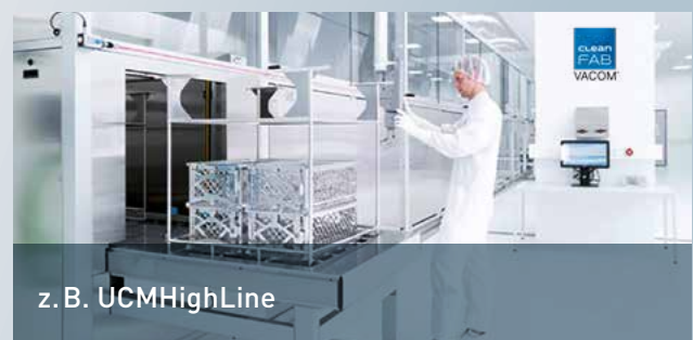
z. B. UCMHighLine