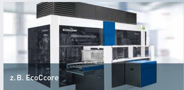
z. B. EcoCcore