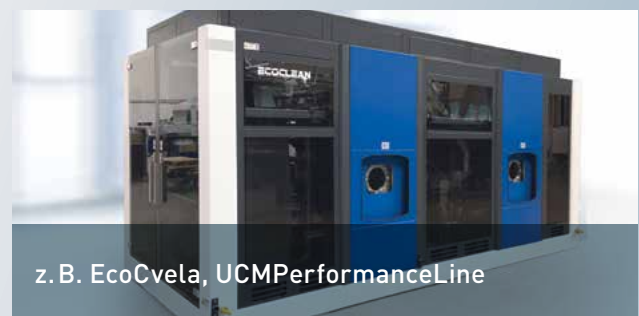
z. B. EcoCvela, UCMPerformanceLine