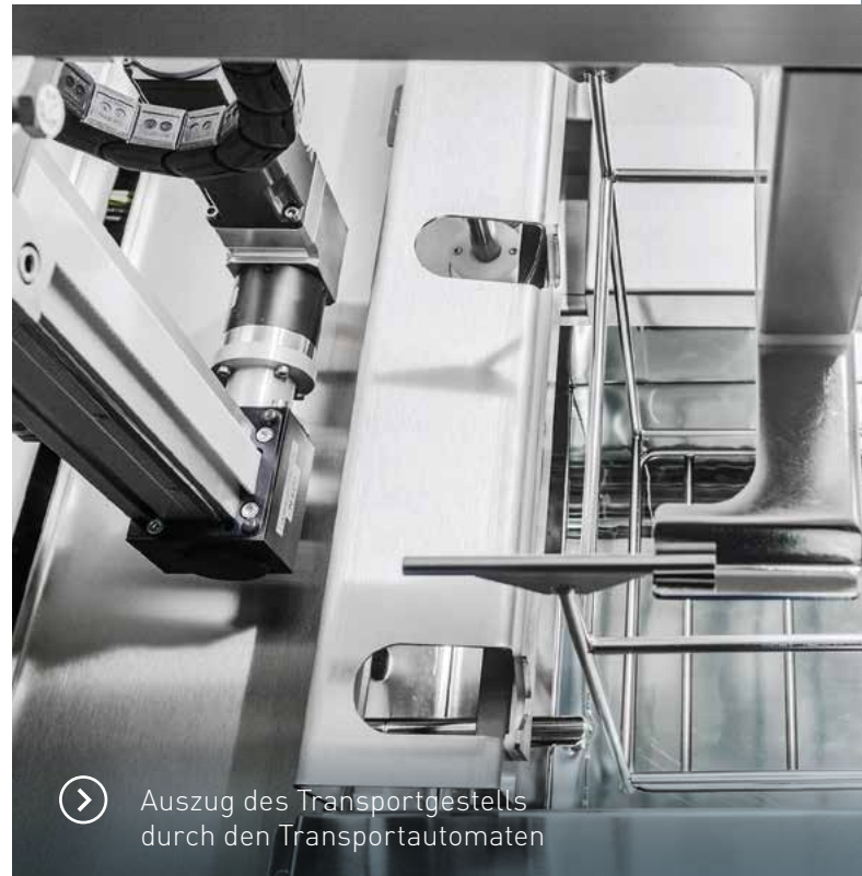
Auszug des Transportgestells durch den Transportautomaten